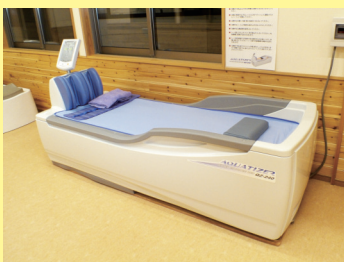
ウォーターマッサージベット