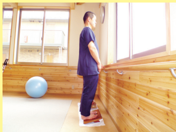
ストレッチボード