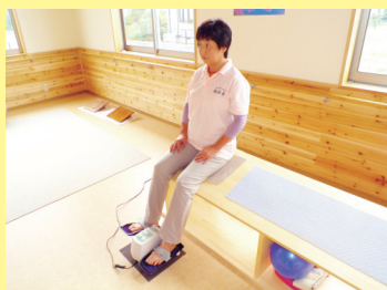
イージーウォーク