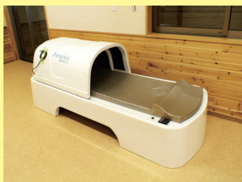
プレヴァンスドーム(岩盤浴マシン)