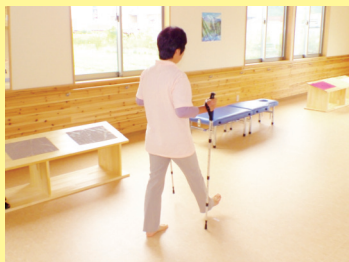
トレッキングポール

利用者様の体調・状況にあわせたトレーニングプログラムを、無理なく楽しみながら行います。 みんなで楽しく汗を流して、健康な体をつくりましょう。